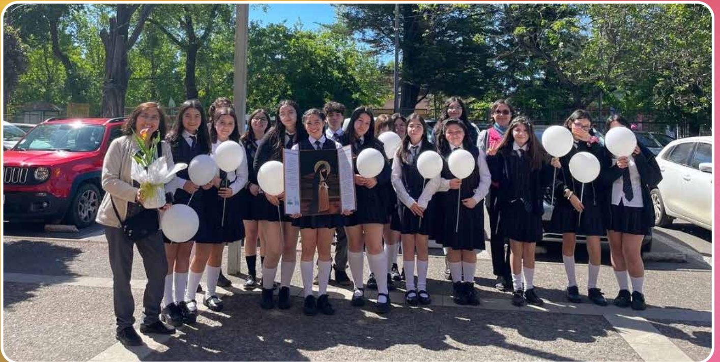
VISITA VIRGEN PEREGRINA