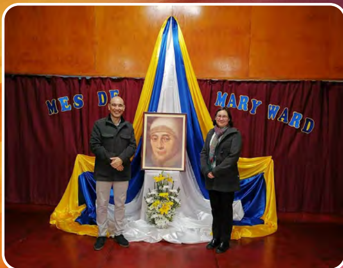
ENCUENTRO CON CRISTO APODERADOS