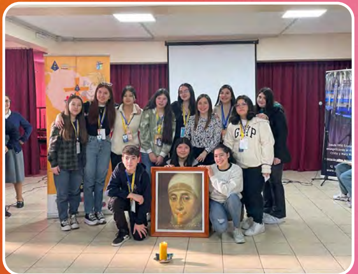
ENCUENTRO DE LÍDERES