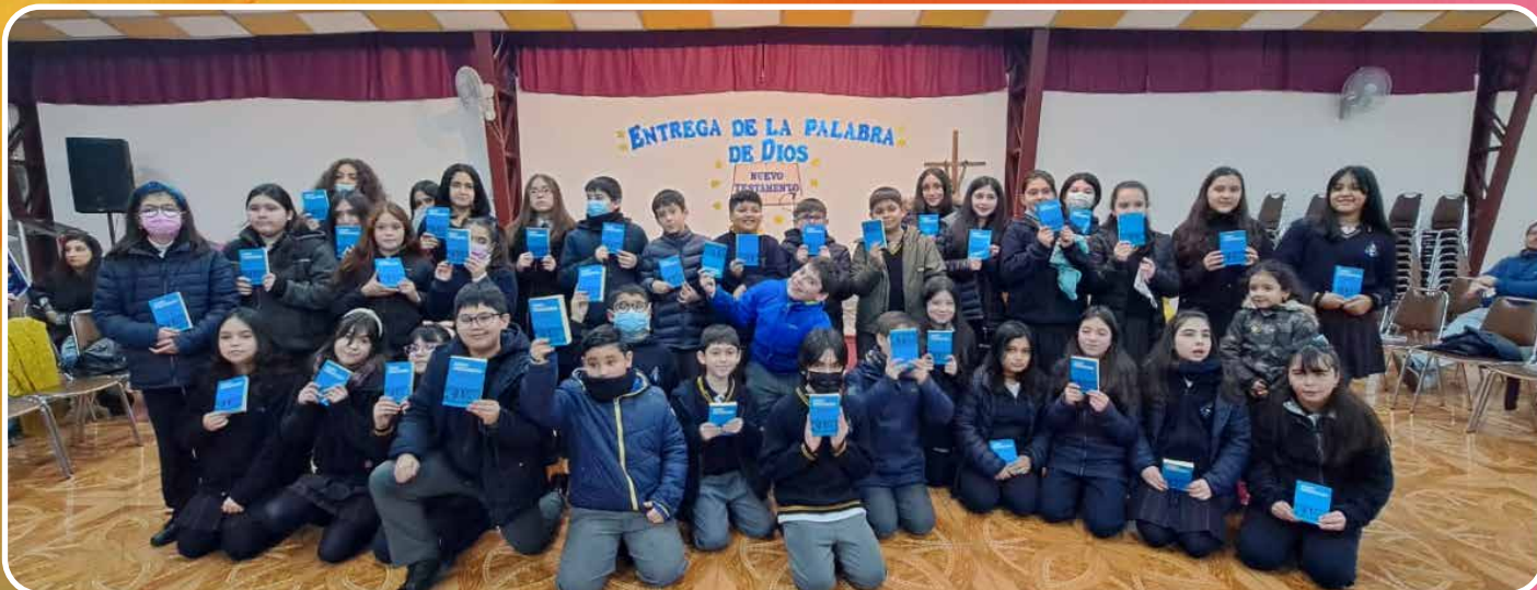
ENTREGA DE LA PALABRA