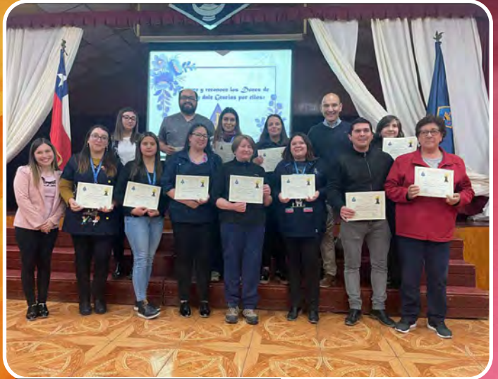
RECONOCIMIENTO VALOR DEL MES