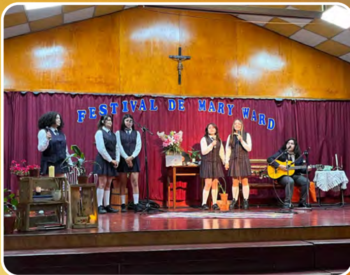
FESTIVAL MARY WARD