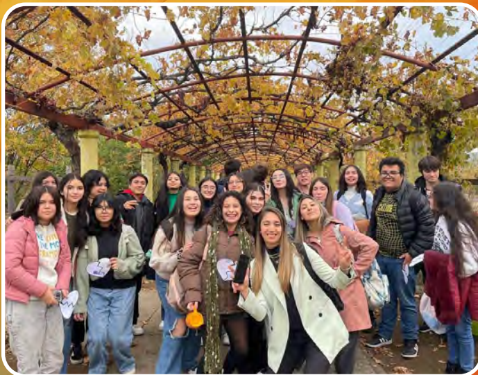
ENCUENTRO CON CRISTO