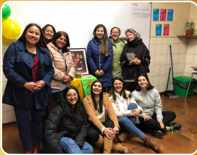
AMIGOS DE MARY WARD