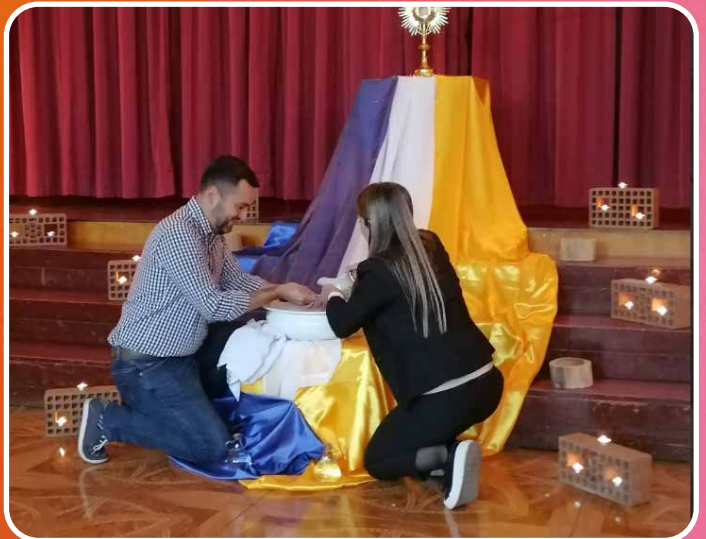
SEMANA SANTA COLABORADORES