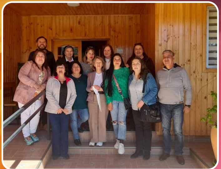
ENCUENTRO CON CRISTO APODERADOS