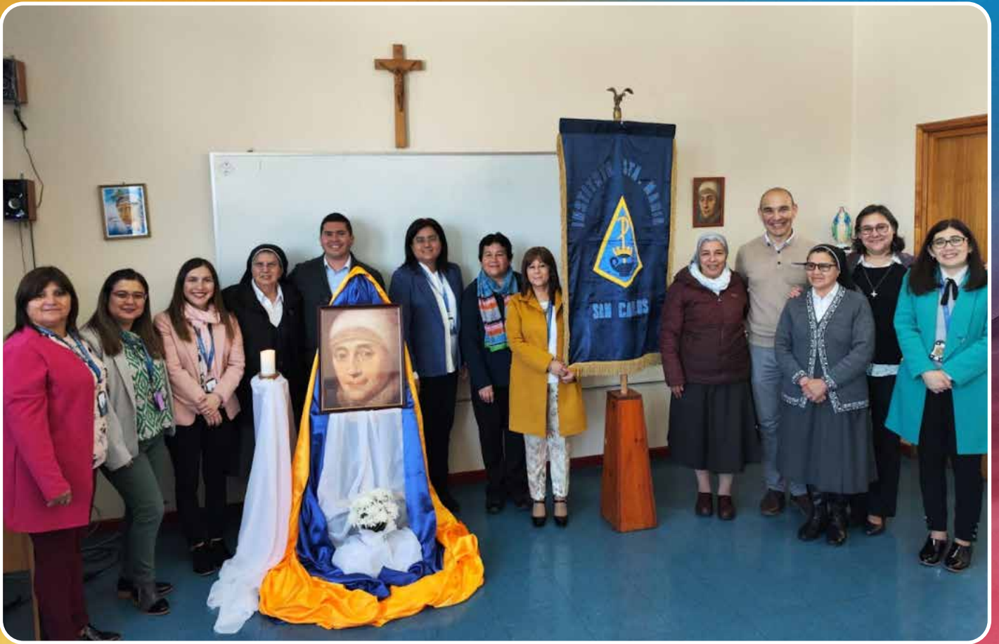
VISITA EQUIPO AMERINDIA