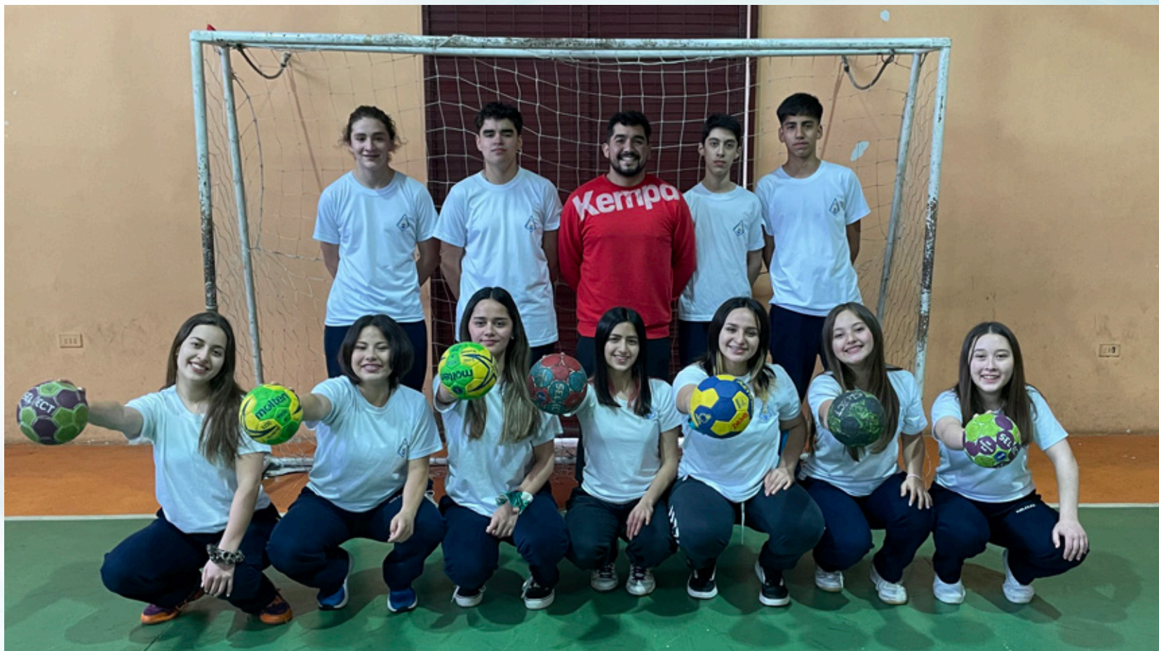
MONITOR: PROF. DIEGO CATALÁN