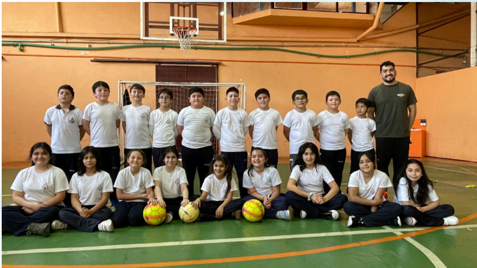
MONITOR: PROF. DIEGO CATALÁN